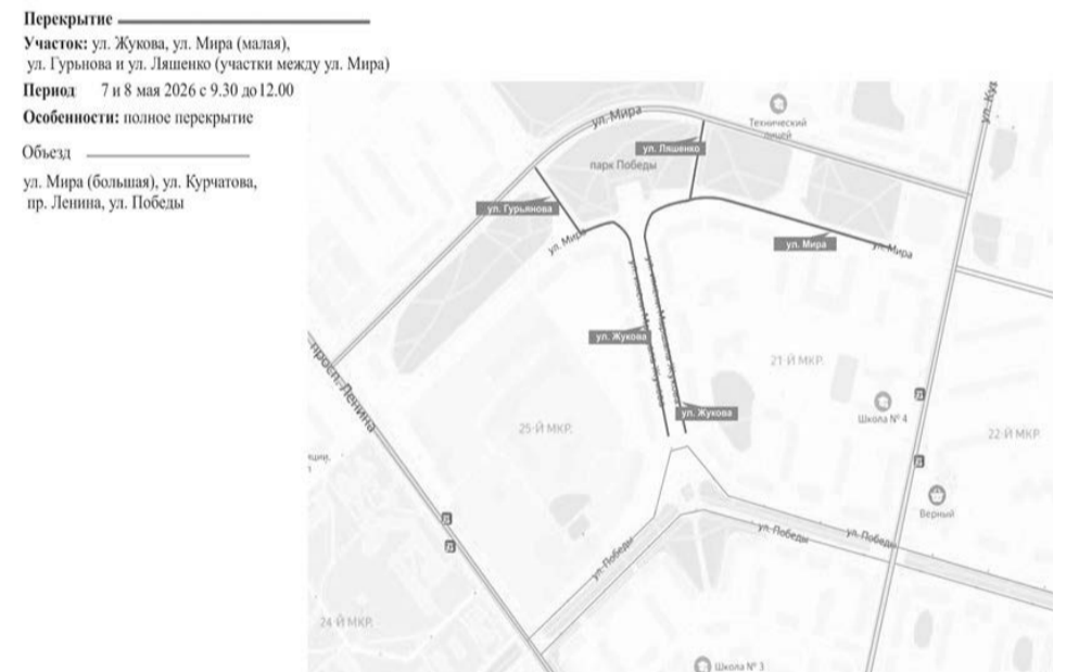
Ограничение движения транспортных средств в период проведения репетиции митинга, посвящённого празднованию Дня Победы в Великой Отечественной войне 1941-1945 гг.

Приложение № 3 к Постановлению администрации города Обнинска от 07.04.2026 № 667-п