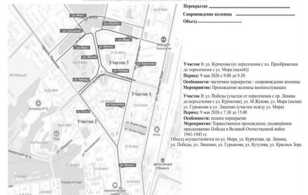
Ограничение движения транспортных средств в период проведения общегородских мероприятий, посвященных Победе в Великой Отечественной войне 1941-1945 гг.

Приложение № 3 к Постановлению администрации города Обнинска от 07.04.2026 № 667-п