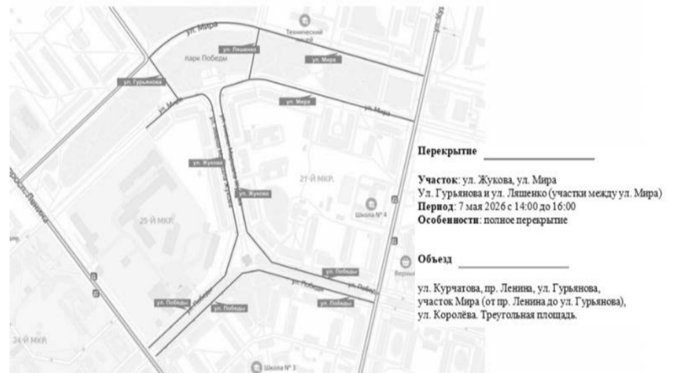
Ограничение движения транспортных средств в период проведения легкоатлетической эстафеты среди учащихся общеобразовательных школ, учебных заведений начального, среднего и высшего профессионального образования, посвященной Победе в Великой Отечественной войне 1941-1945 гг.

Приложение № 2 к Постановлению администрации города Обнинска от 07.04.2026 № 667-п