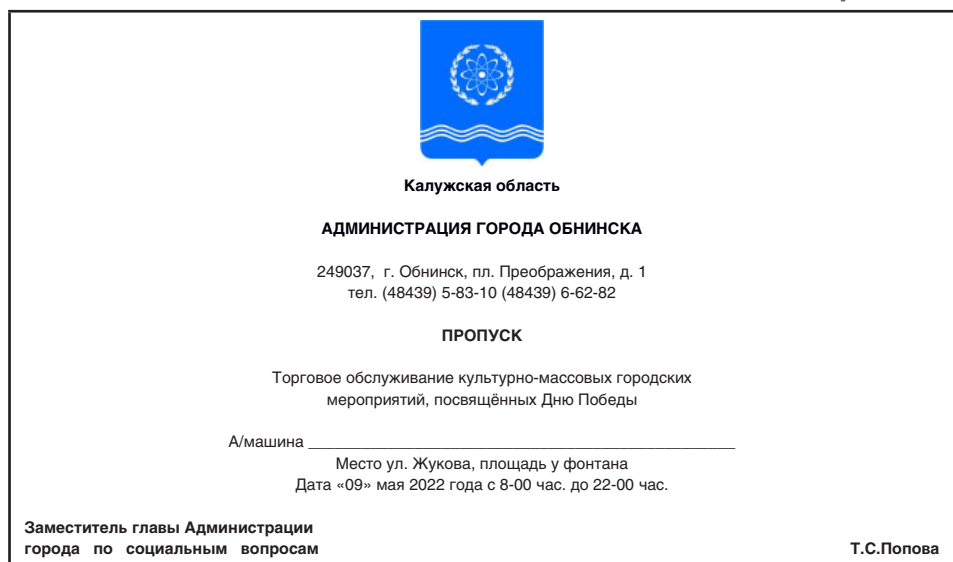
Приложение № 4 к постановлению Администрации города 14.04.2022 № 726-п