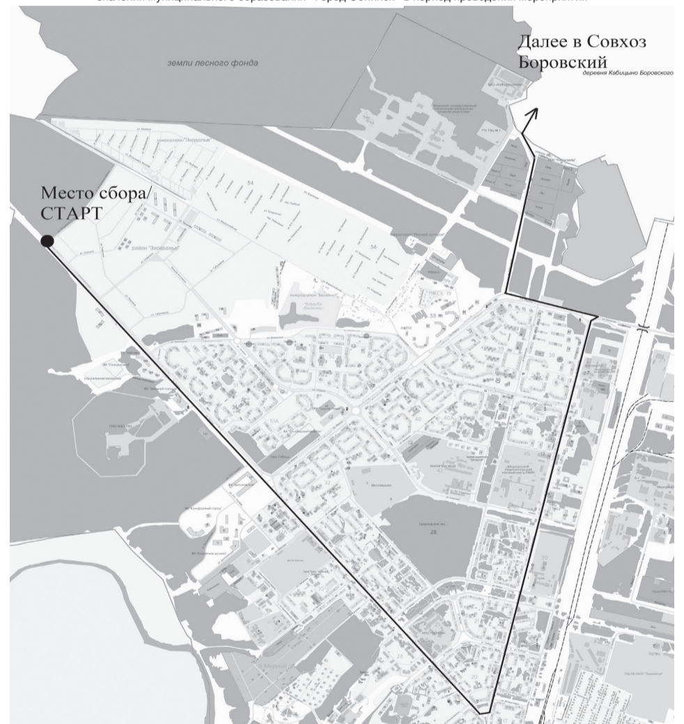
Схема временного ограничения движения транспортных средств по автомобильным дорогам общего пользования местного значения муниципального образования «Город Обнинск» в период проведения мероприятия

АДМИНИСТРАЦИЯ ГОРОДА ОБНИНСКА ПОСТАНОВЛЕНИЕ